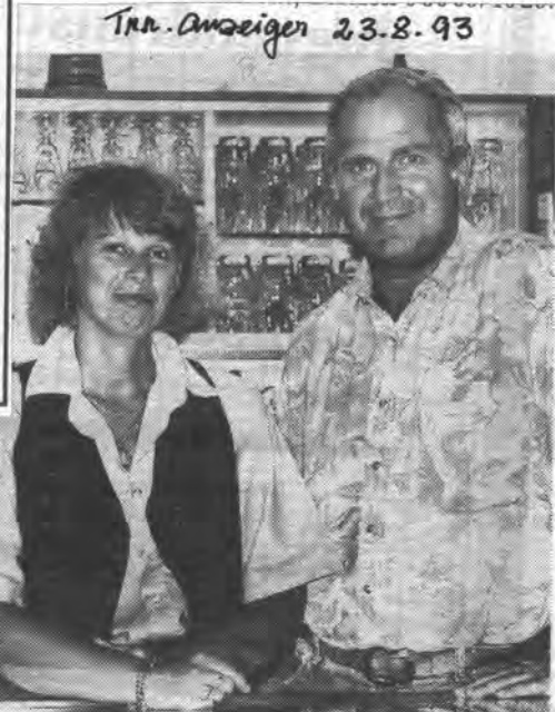
Trn. Amzeigen 23.8.93

Gruppe 2: 1. TV Obing 24:04, 2. SV Bad Häring 21:07, 3. SV Seon 20:08/2,288, 4. SV Hirten 20:08/1,614, 5. ESC Freutsmos 16:12/1,163, 6. TSV Trostberg II 16:12/1,026, 7. EC Bergen 16:12/0,961, 8. SC Anger 14:14/0,922, 9. EV Harpzing 14:14/0,909, 10. TSV Fridolfing 14:14/0,771, 11. TSV Stein-St. Georgen II 12:16, 12. TSV Grabenstätt 08:20, 13. DJK Traunstein 07:21, 14. TSV Marquartstein 05:23, 15. TSV Chieming 03:25.