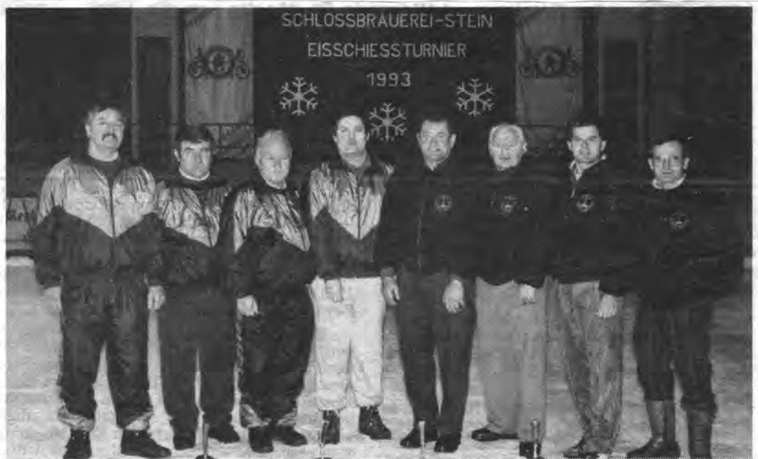
Sie gewannen das Dreikönigs-Turnier der Schloßbrauerei Stein: der EC Übersee (links) in der Gruppe A und das Team vom TSV Chieming in der Gruppe B (rechts).