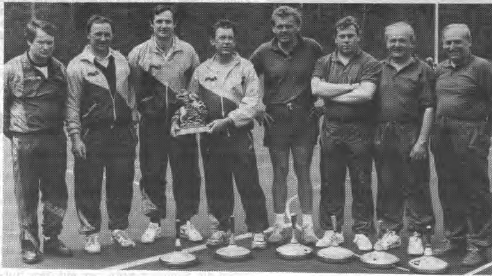
Im Endspiel um die St. Georgs-Wandertrophäe besiegte Union Peuerbach aus Oberösterreich (links) den TV Obing mit 11:8 Punkten.